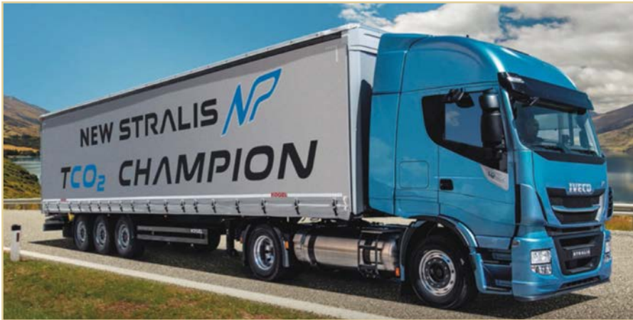
Figura 1. Nuevo IVECO Stralis. Puede apreciarse debajo de la cabina el depósito de GNL