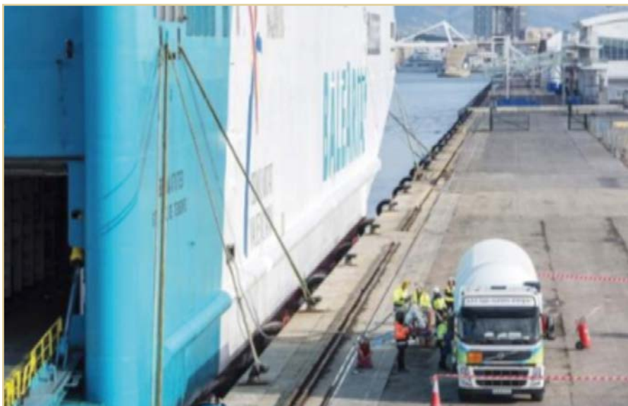
Figura 6. Buque Abel Matutes realizando bunkering de GNL