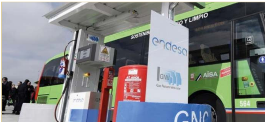
Figura 2. Estación GNC