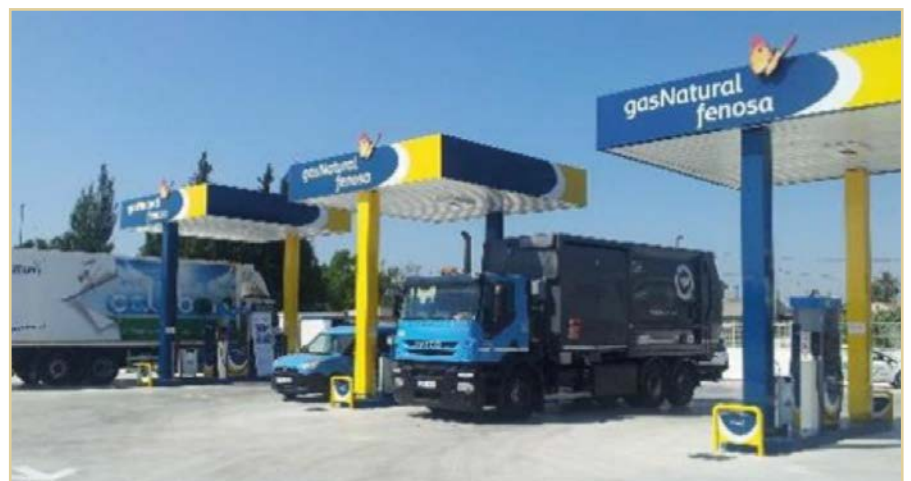
Figura 3. Estación GNL/GNC

Para el suministro de GNC se suele disponer de un recuperador del gas de boil-off (gas vaporizado por calentamiento del GNL almacenado en el depósito), y un compresor encargado de aumentar su presión previamente a su almacenamiento en el rack de botellas, y en los casos en que se prevé una mayor demanda de GNC, de bombas criogénicas de pistones que elevan la presión del GNL hasta 250