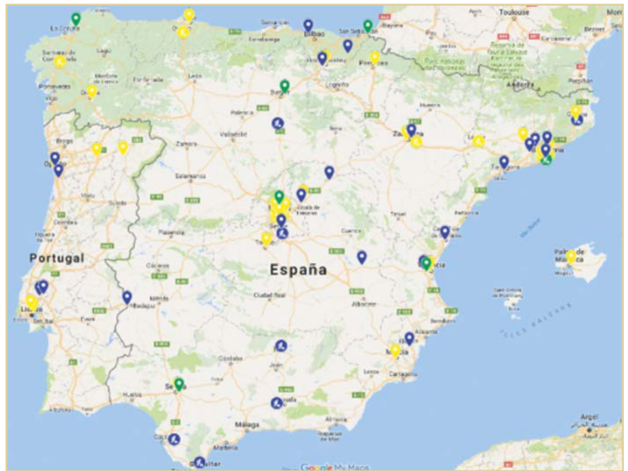
Figura 4. Mapa de Estaciones Públicas en la Península Ibérica

Se deben normalizar y estandarizar diversos aspectos relativos a las estaciones y a los propios vehículos, así como especificar la calidad del GNL (composición y número de metano, similar al octanaje en gasolina), que cambia en función de las plantas de licuefacción en origen de las que procede el GNL. Para GNL ligero o de poca densidad, con mayor porcentaje de metano en su composición, resultan números de metano altos y adecuados para su uso vehicular. Si el GNL tiene mayores concentraciones de etano y fracciones más pesadas, el número de metano desciende. Este es un aspecto relevante, ya que los motores a gas pueden llegar a presentar problemas de knocking (detonación) si el número de metano no es lo suficientemente alto. Los motores dual